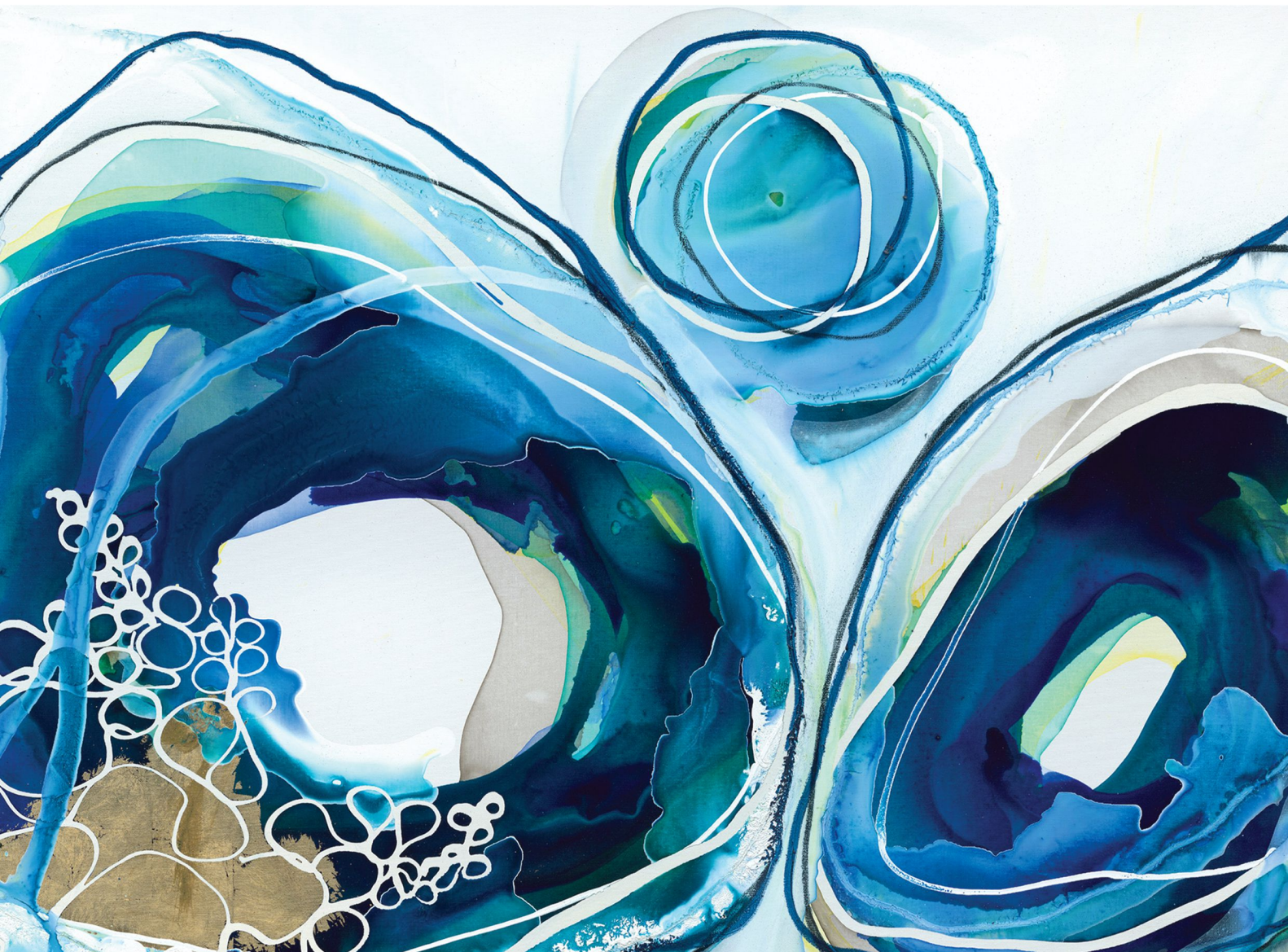
"Ocean Eyes III" (detail) by Lara Scolari, Australia, Room 4304